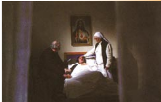
(Casa Famiglia - Castellace )

Il servizio mette a disposizione, su richiesta, le video cassette che documentano tutta la campagna di promozione 2003.